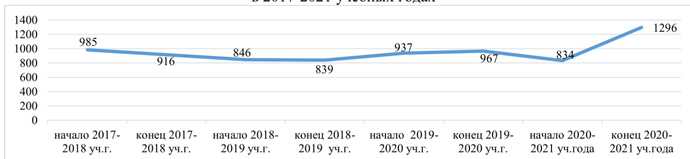
Динамика изменения количественного состава обучающихся МБУ ДО ДДТ в 2017-2021 учебных годах

На основании проведенного анализа полученных статистических данных, анализов деятельности, отчетов педагогов дополнительного образования и руководителей структурных подразделений, можно сделать следующие выводы: