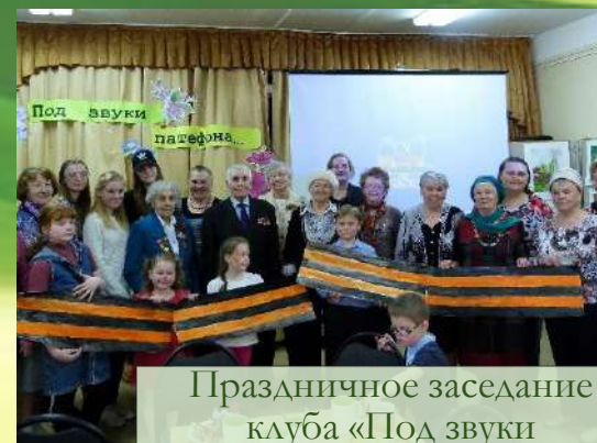
Праздничное заседание клуба «Под звуки патефона...»