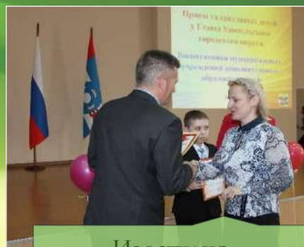
Изостудия «РЫЖИЙ КОТ»