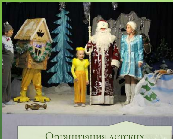
Организация детских праздничных программ: «Новый год»