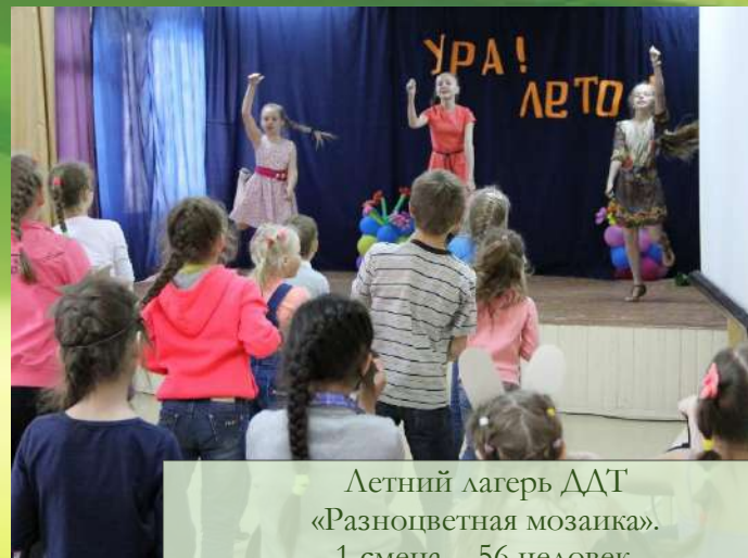
Летний лагерь ДДТ «Разноцветная мозаика». 1 смена – 56 человек, 3 смена – 60 человек