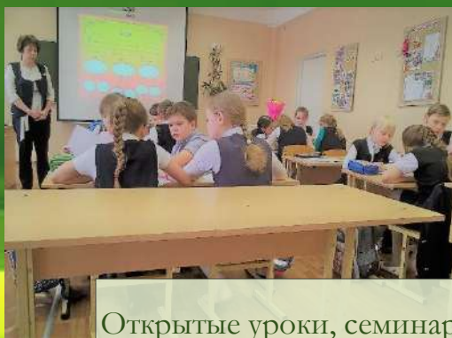
Открытые уроки, семинары