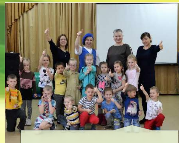
Курс подготовки к школе «Умка» (для детей 5-7 лет)