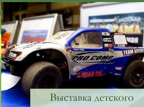
Выставка детского технического творчества