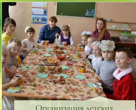
Организация детских праздничных программ: «День рождения»