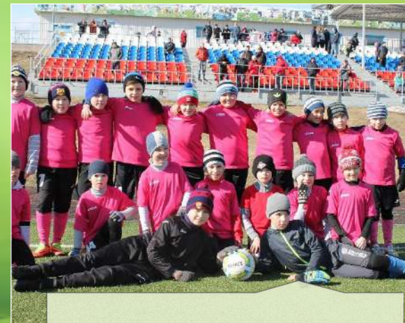
Курс подготовки юных футболистов