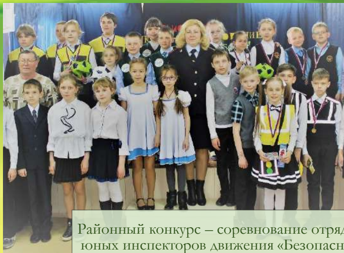
Районный конкурс – соревнование отрядов юных инспекторов движения «Безопасное колесо»