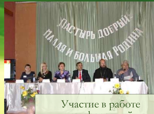
Участие в работе конференций