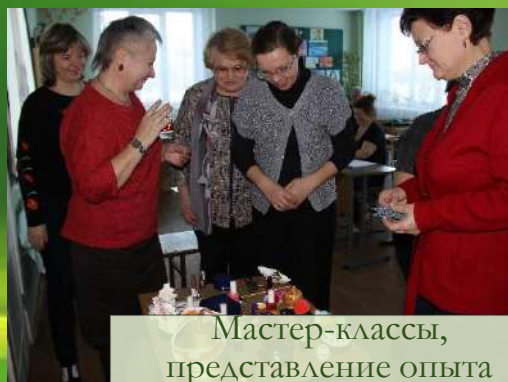
Мастер-классы, представление опыта работы