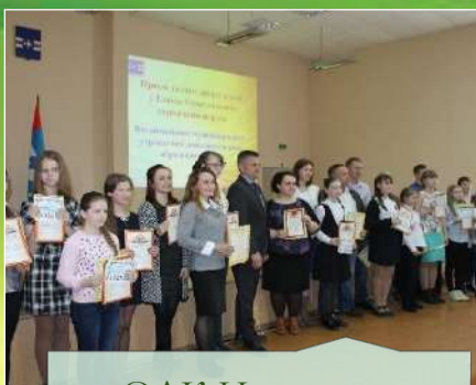
ОДК Изостудия «Спектр»