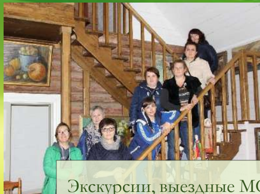
Экскурсии, выездные МО