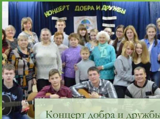
Концерт добра и дружбы