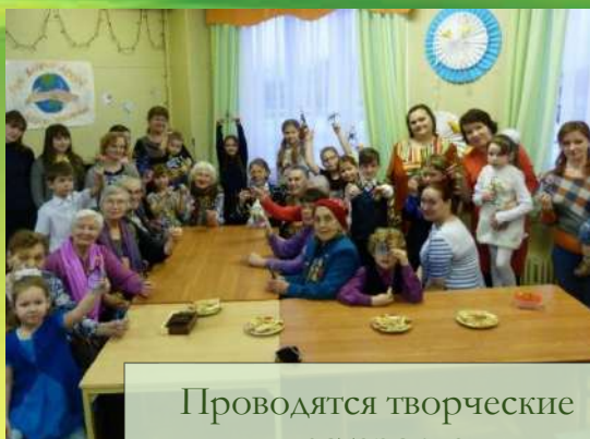
Проводятся творческие мастерские,