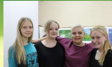
Основы медицинских знаний