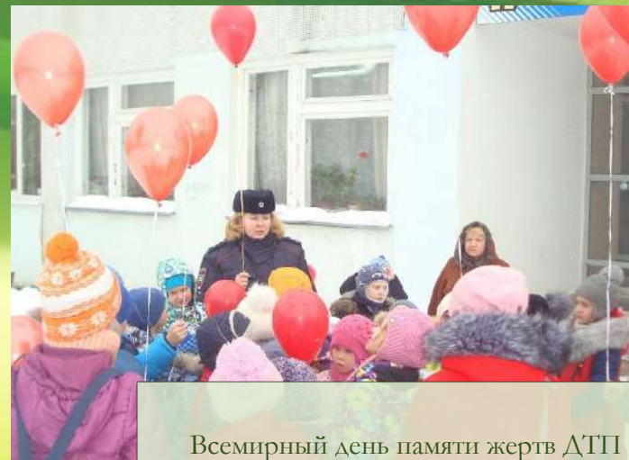
Всемирный день памяти жертв ДТП