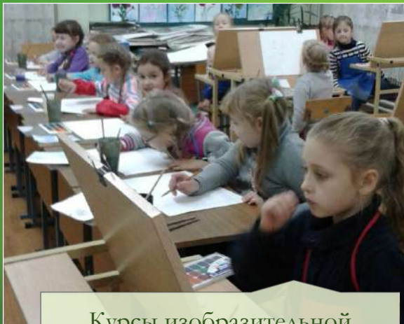
Курсы изобразительной грамотности «Лучик» (для детей 6-8 лет)