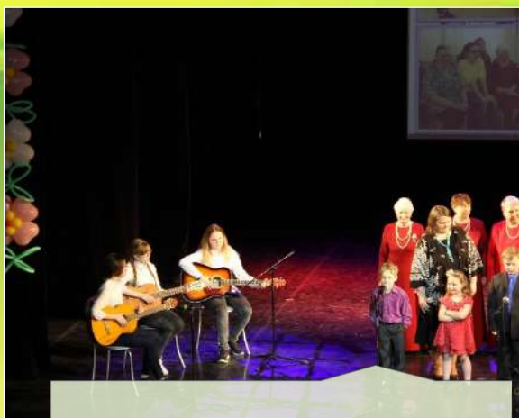
Курс обучения игре на гитаре