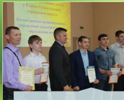
СБЕ «10 лепестков»