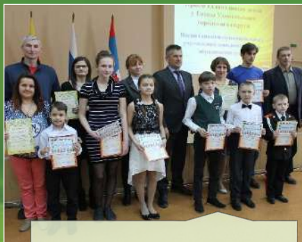
«Каратэ – до»