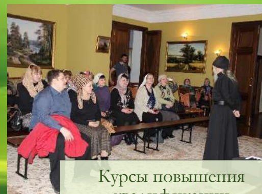
Курсы повышения квалификации