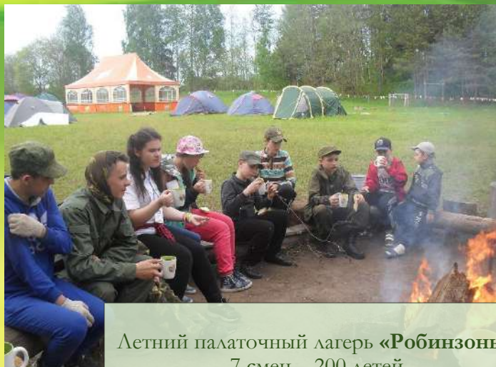
Летний палаточный лагерь «Робинзоны» 7 смен – 200 детей