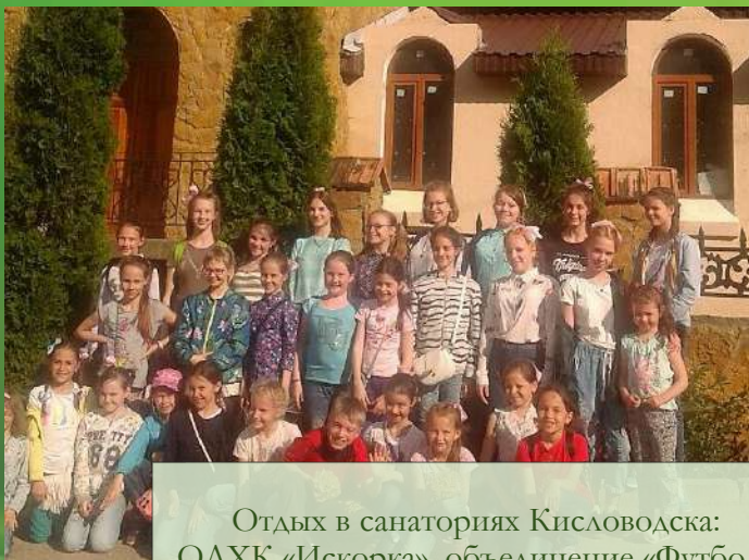
Отдых в санаториях Кисловодска: ОДХК «Искорка», объединение «Футбол»