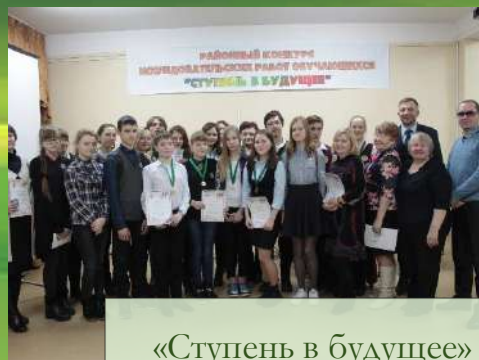
«Ступень в будущее»