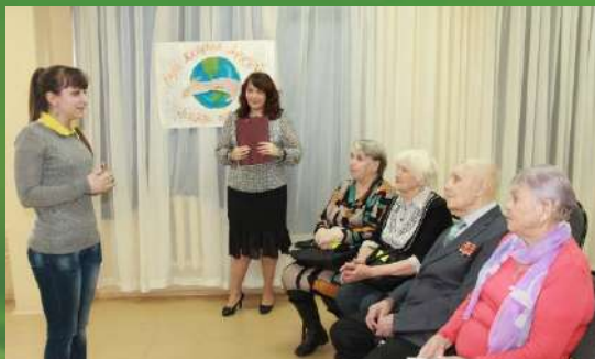
Продолжается работа Клуба добрых друзей