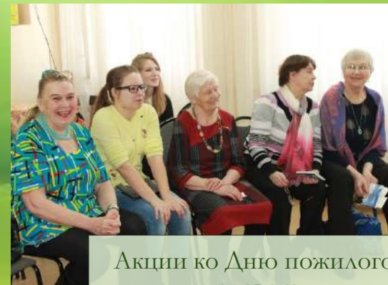
Акции ко Дню пожилого человека.