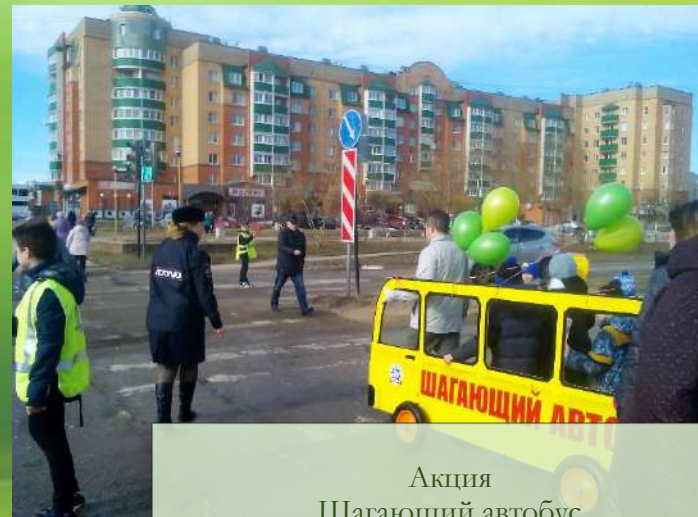
Акция Шагающий автобус