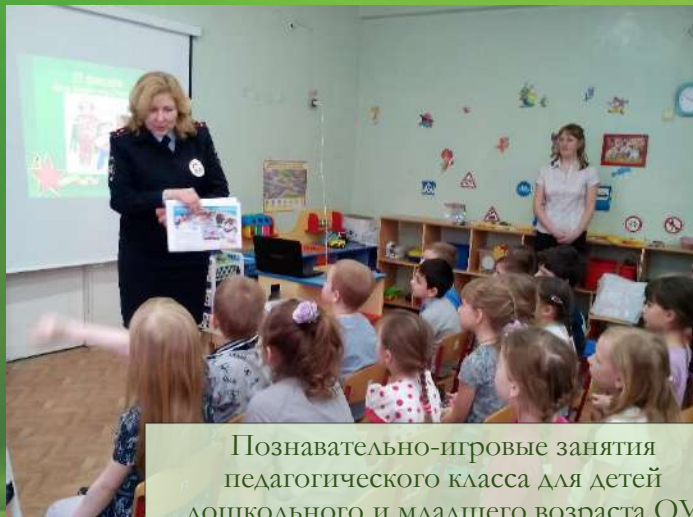
Познавательные-игровые занятия педагогического класса для детей дошкольного и младшего возраста ОУ города